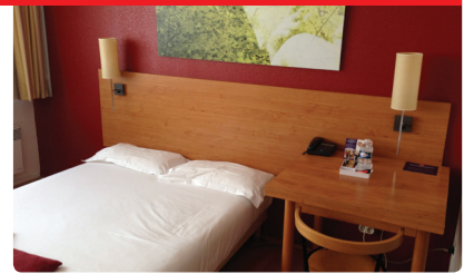
Camera da letto standard