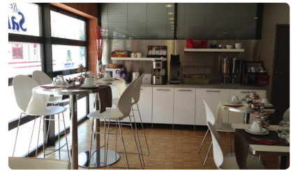
Stanza della colazione